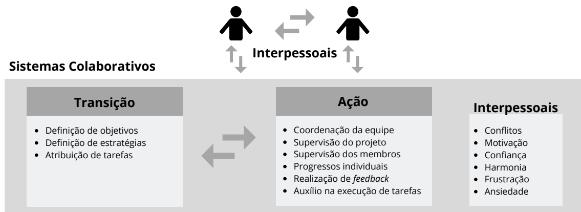
Figura 1. Tópicos relacionados aos processos de equipe (transição, ação e interpessoais) e relação destes em ambientes colaborativos.

A teoria de Marks, Mathieu e Zaccaro (2001) aponta que os processos de uma equipe podem ser subdivididos em processos de transição (planejamento do projeto), ação (execução do projeto) e interpessoais, como mostra a Figura 1.