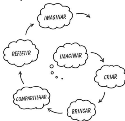
Figura 1. Espiral da Aprendizagem Criativa

Seguindo a teoria de Seymour Papert, Resnick (2020) apresenta a espiral da Aprendizagem Criativa que propõe o desenvolvimento da criatividade na aprendizagem com base em seis aspectos do processo: Imaginar, Criar, Brincar, Compartilhar, Refletir e Imaginar, como mostra a Figura 1. No aspecto Imaginar, os alunos iniciam o processo pensando o que querem criar, desenvolver; em Criar, eles transformam este pensamento em ações, aplicando suas ideias nos projetos; no Brincar, os estudantes experimentam e interagem com suas criações; em Compartilhar, partilha-se ideias, colaborando com os colegas, trocando informações entre si e em grupos; em Refletir, os alunos repensam o que fizeram e aprenderam até o momento e ao longo do processo, aperfeiçoam suas criações, retomam o processo de aprendizagem da espiral no aspecto Imaginar, pensando em novas ideias e com novas orientações, aprimorando suas criações.