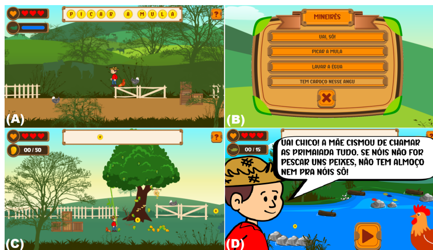
Figura 2. (A) Coleta da expressão “Picar a Mula” e cenário do interior de Minas Gerais. (B) Mural de expressões encontradas pelo jogador e suas origens. (C) Coletando fruta na copa da árvore e abelhas saindo da colmeia. (D) Tião explicando para o Chico o motivo de eles terem que executar a tarefa.

Em termos de narrativa , são apresentados o Tião e o Chico como personagens. Tião é um menino do interior de MG, muito curioso e quer saber a origem das expressões que ele tanta escuta e fala. Chico é o seu galo de estimação, inseparável que ajuda Tião e o segue a todos os lugares. É comum no interior de MG, que as pessoas façam tarefas (“afazêres”) na roça por pedido dos pais ou pessoas mais velhas (Figura 2(D)). Assim, na história do jogo, a mãe de Tião prometeu que, a cada tarefa terminada pelo menino, ela contaria a origem de uma expressão do “mineirês”. Portanto, muitos dos feedbacks educativos e dos objetivos do jogo se alinham à narrativa, uma vez que para conhecer a origem das expressões é necessário coletar todas as letras, concluir as tarefas e somente assim, a “mãe irá dizer de onde surgiu esses trem”. Além disso, nas falas dos personagens, busca-se representar o modo como os mineiros falam.