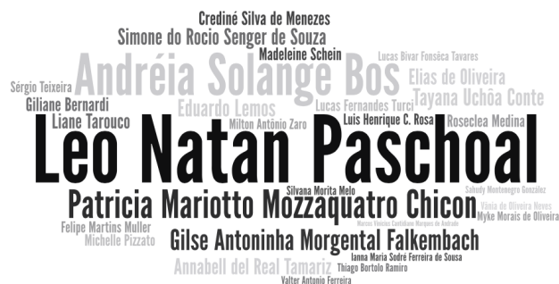
Figura 2. Autores que mais publicam na área.